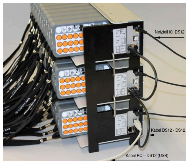
Docking-Station DS12, Kaskadierung