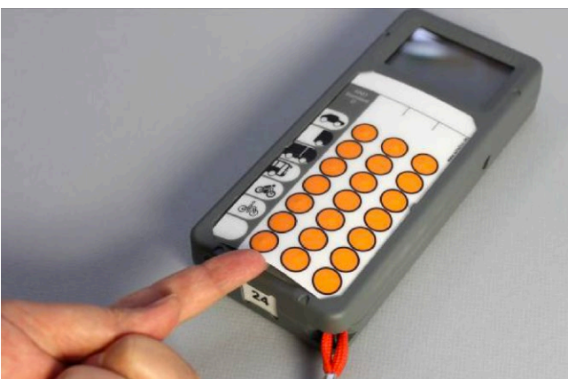
Auswechseln der Beschriftungsfolie

Grundsätzlich schaltet sich das Gerät während den Passivzeiten (außerhalb der Zählzeiten) ab, kann aber über einen Tastendruck jederzeit aktiviert werden. Über einen einstellbaren Zeitparameter schaltet sich das Gerät rechtzeitig vor Zählbeginn automatisch ein (z.B. 5 Minuten vorher). Während der Zählung bleibt das Display aktiv.